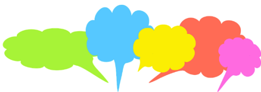
Bild: gerald / pixabay.com, Pixabay-Lizenz: freie kommerz. Nutzung

Tool zur Generierung von Wortwolken / TagClouds